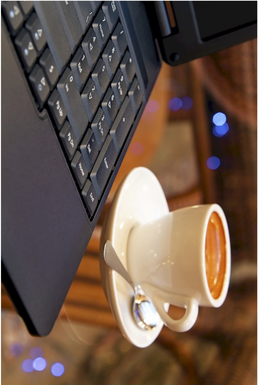
Obr. B.2: Káva a počítač [1]