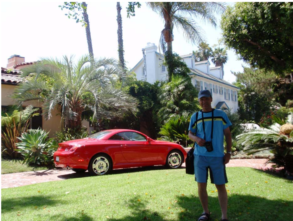
Některé domy zde jsou opravdu zajímavé, skoro jako ty od Stowasser ve Vídni: