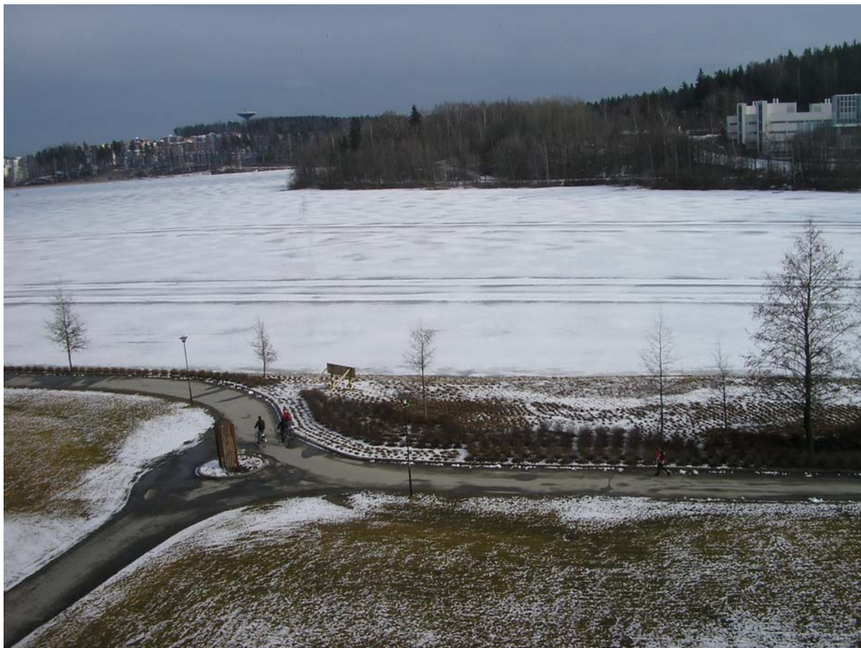
Jezero v podvečer: