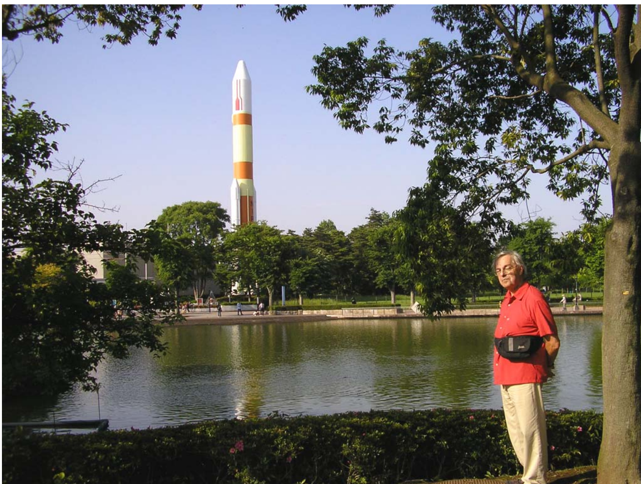
Večer jsme absolvovali první večeri zde v Tsukuba. Dlouho jsme hledali restauraci, až jsme nakonec zakotvili v naší hotelové. A pak rychle do postele, protože ráno jsme naplánovali výlet