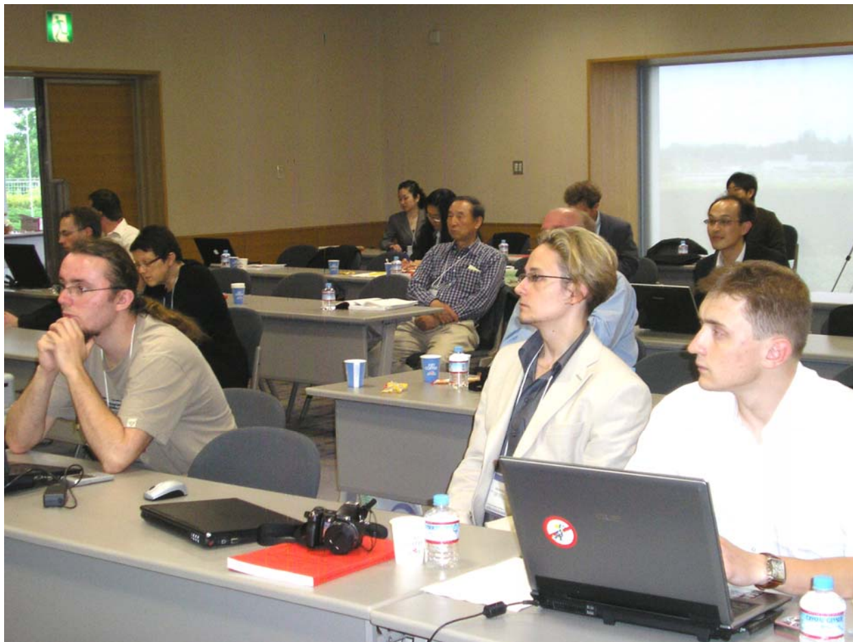
Uvnitř kongresového centra to bylo pěkné: