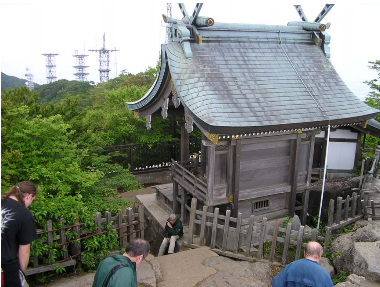
Však je pěkná, že?