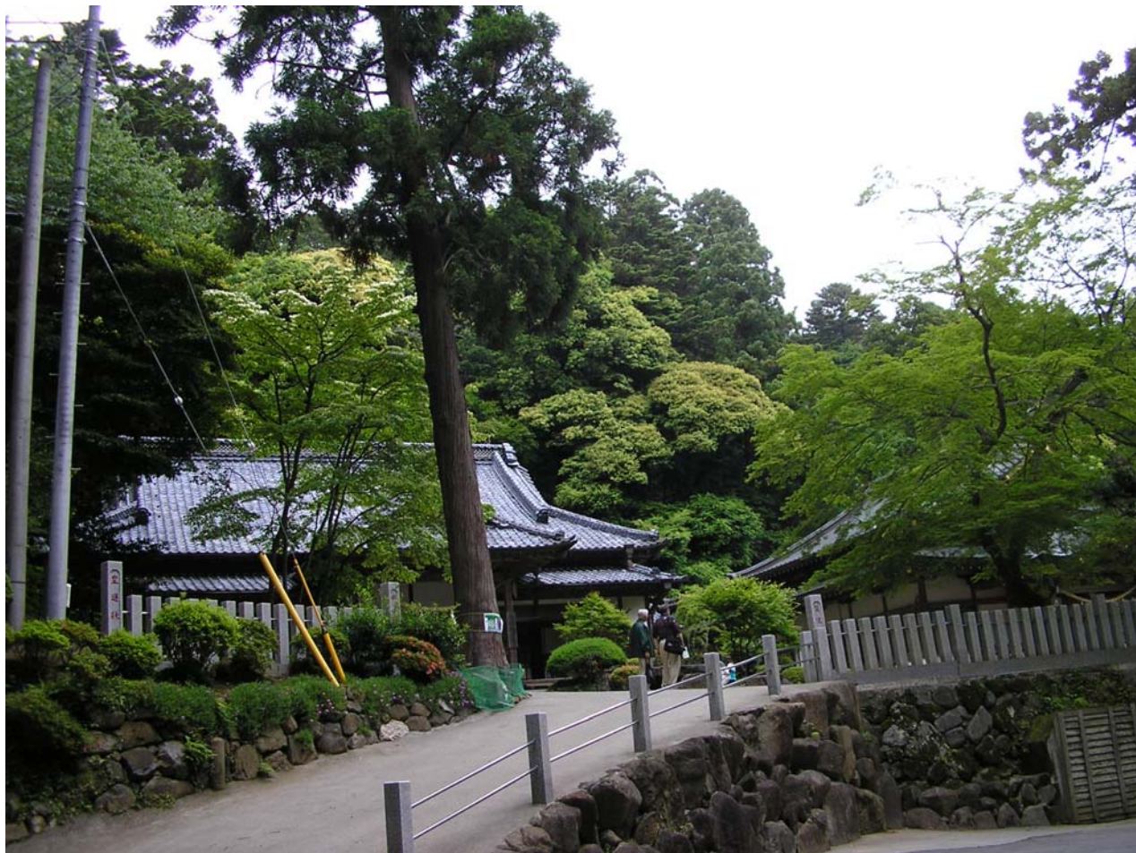
To ještě pořad není ten Temple: