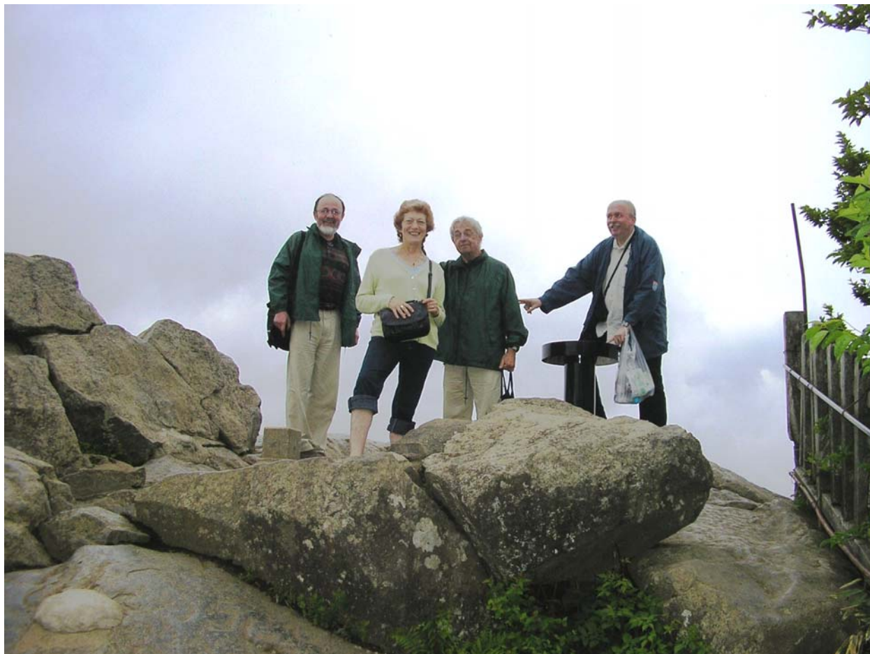
Za mnou je ten druhý vrchol, na který jsme už nešli: